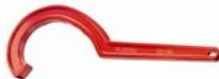
Monteringsnøkkel for PP Hurtigkoblinger 16mm – 40mm 40mm – 75mm 63mm – 125mm